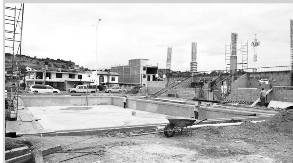
La obra más cara en la cartera de proyectos se tiene contemplada en Tamazula, donde la pavimentación de 2.1 kilómetros costará 30 millones de pesos.