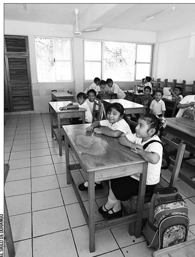
EL SIGLO DE DURANGO

Además, el Ayuntamiento en la nómina del Sistema para el Desarrollo Integral de la Familia (DIF) cuenta con algunos médicos que suelen consultar al personal del municipio en caso de enfermedad.