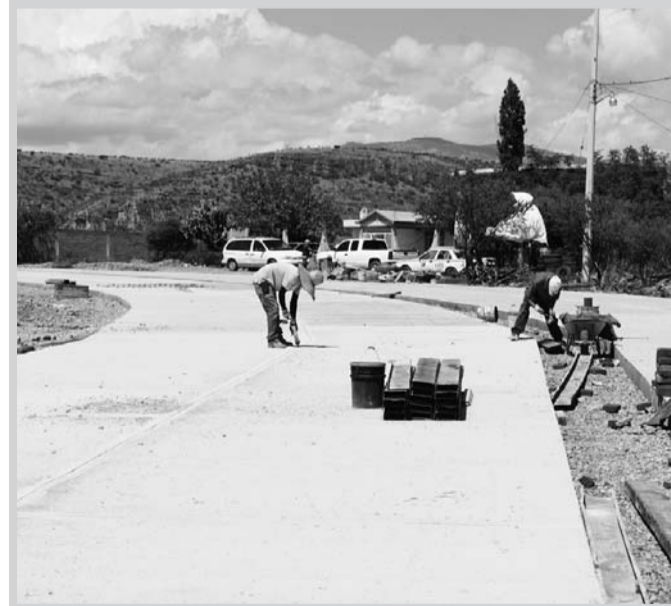
El grueso de los proyectos a ejecutar tienen que ver con obras de infraestructura en servicios básicos.

YULMA ALVARADO EL SIGLO DE DURANGO Guanaceví, Dgo.