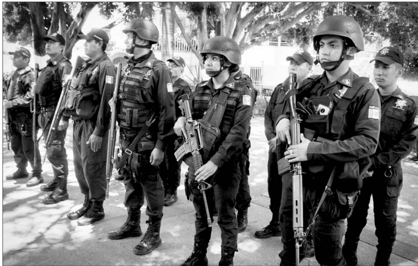
Riesgo. La de policía es una de las ocupaciones consideradas de alto riesgo.

Algunos empleados tienen Seguro Popular; a otros se les paga la medicina.