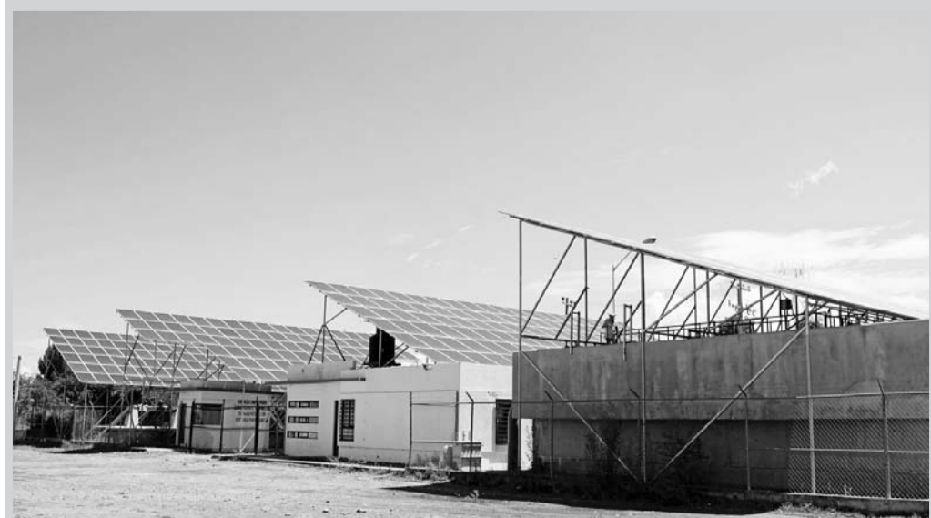
Indé es el municipio que menos proyectos va a ejecutar con este recurso debido al bajo nivel del Fondo que recibe.