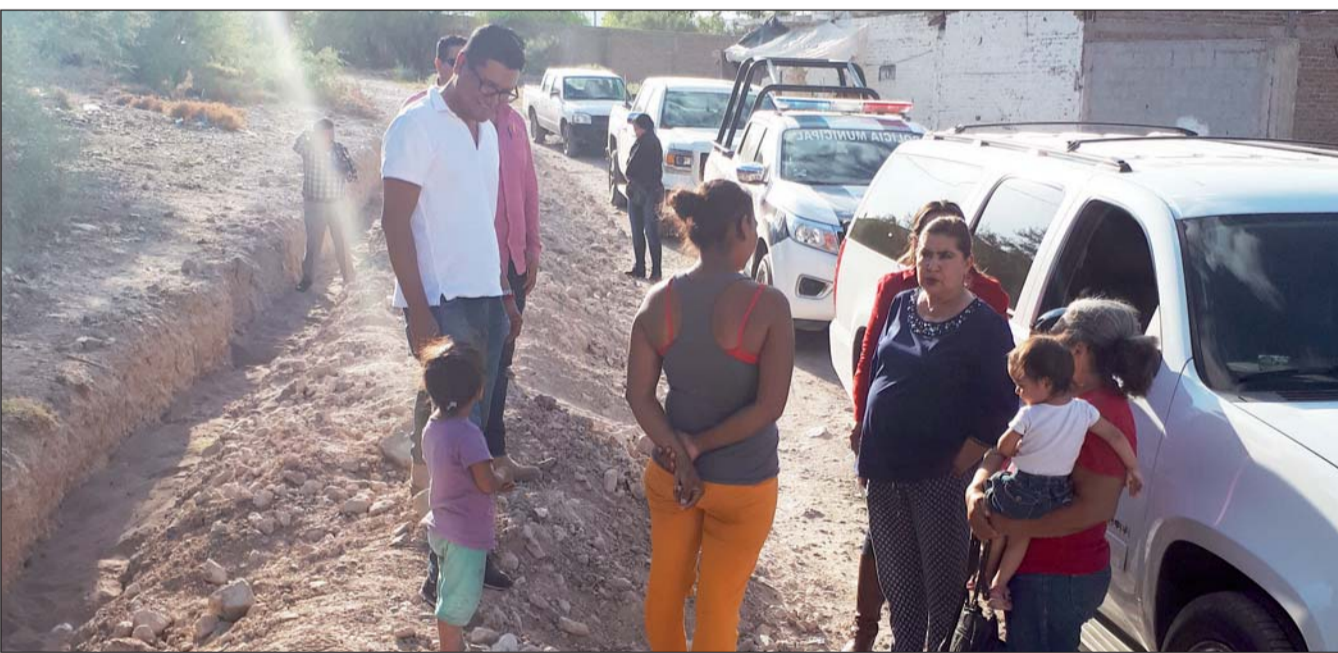
Recorrido. En el lugar donde se ejecutan los trabajos de ampliación de la red de agua potable, autoridades municipales constataron el avance de la obra, que también fue corroborado por los beneficiarios.

Actualmente, México recibe más ingresos por exportar productos agropecuarios por encima del petróleo, del turismo y de las propias remesas que envían nuestros paisanos, y superando desigualdades, los productores de Durango tenemos que crecer al ritmo del campo mexicano, terminó subrayando.