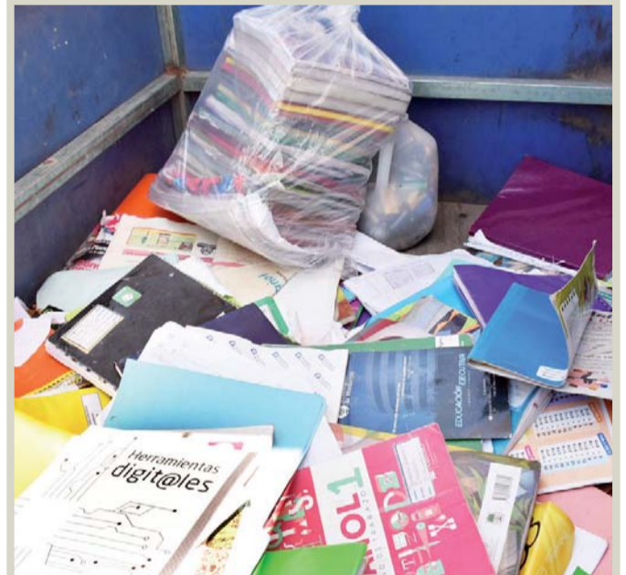
Objetos. Entregan cuadernos, libretas y libros.