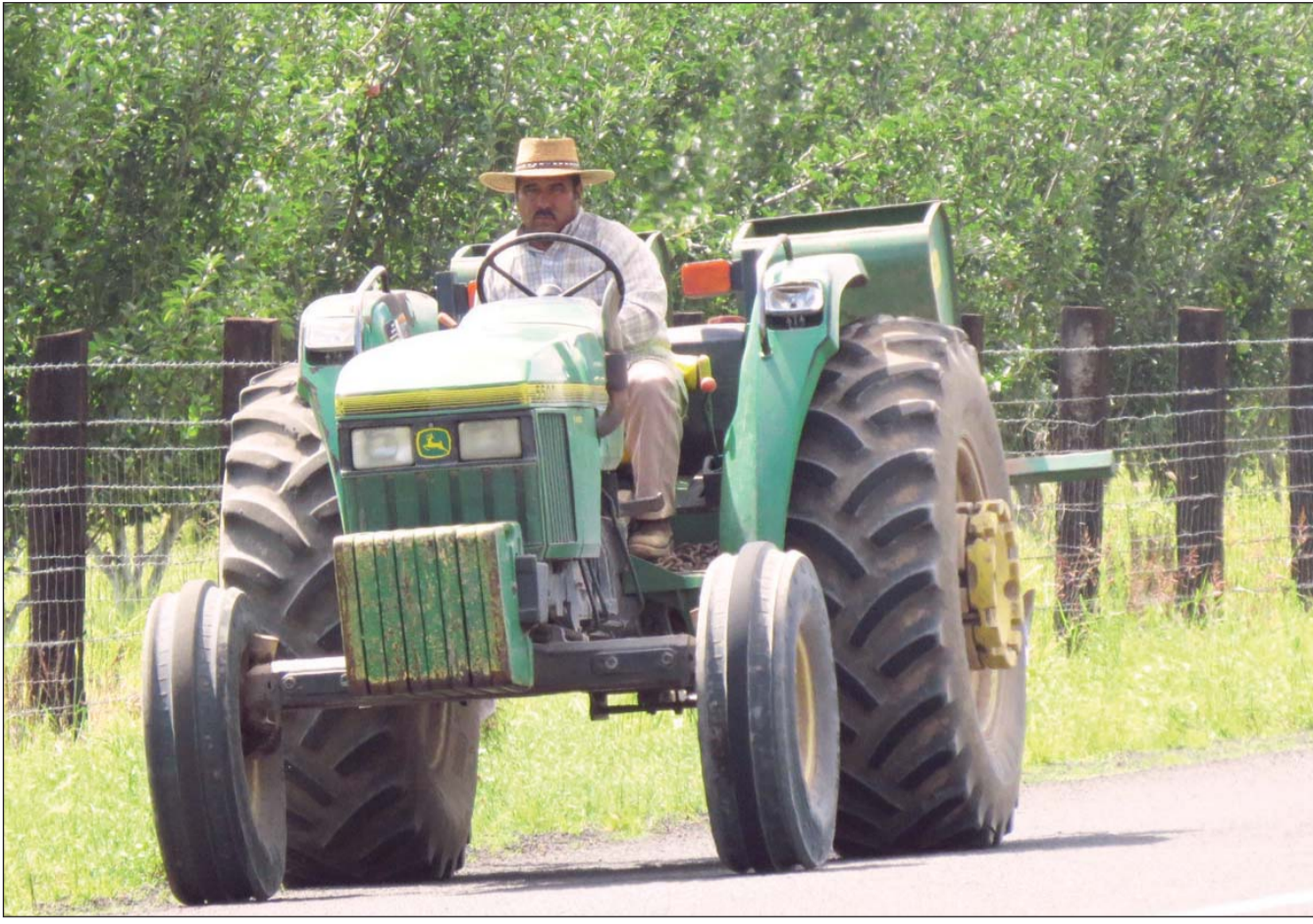
Respaldo. Los tractores son instrumentos de trabajo muy valiosos para los productores de Canatlán.