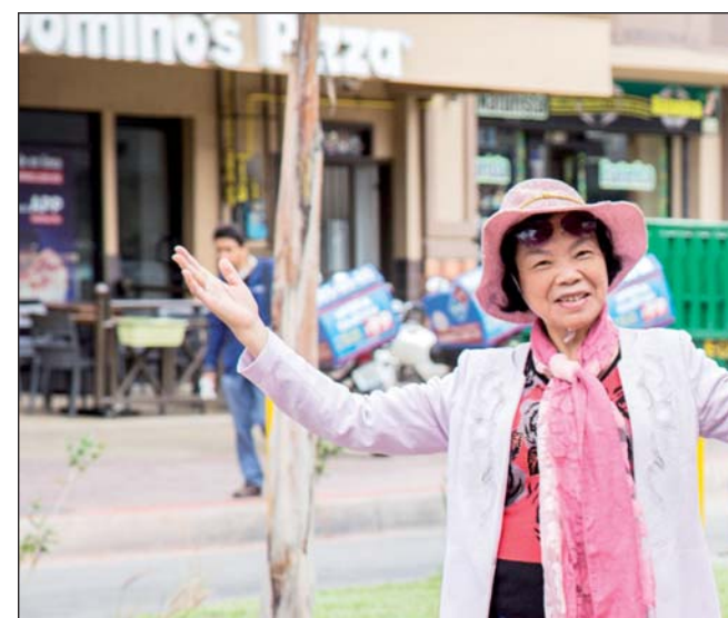
Decisión. Los turistas y visitantes han estado cancelando viajes que tenían planeados al estado mexicano de Baja California luego que el cruce fronterizo fue cerrado brevemente.

Miles de migrantes centroamericanos, la mayoría de ellos hondureños,