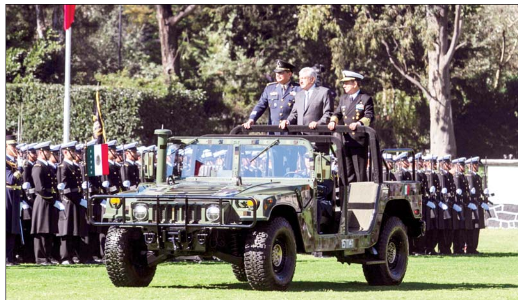
Responsabilidad. Las fuerzas armadas no solo deberán enfocarse en la seguridad nacional.

Dijo que el asistencialismo y el socialismo que, según su visión, propone López Obrador, no ha funcionado a nivel mundial.