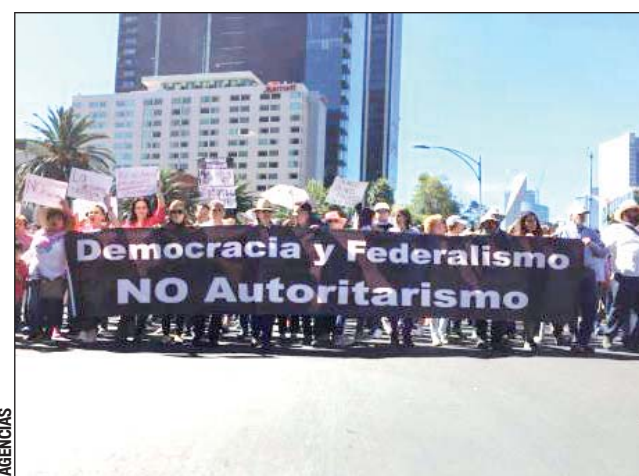
Postura. Los manifestantes se mostraron en contra de algunas de sus decisiones de Gobierno como la militarización.