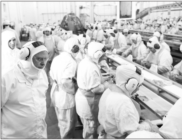
Producción. Solo la zona norte siembra anualmente 165 mil 400 hectáreas de cultivos agrícolas y produce por año 2.7 millones de toneladas de alimentos.