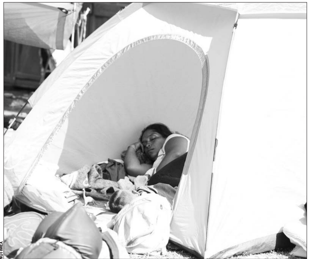
Llegada. Según datos de autoridades mexicanas, unos nueve mil centroamericanos llegaron al país a partir del 19 de octubre en distintos grupos.