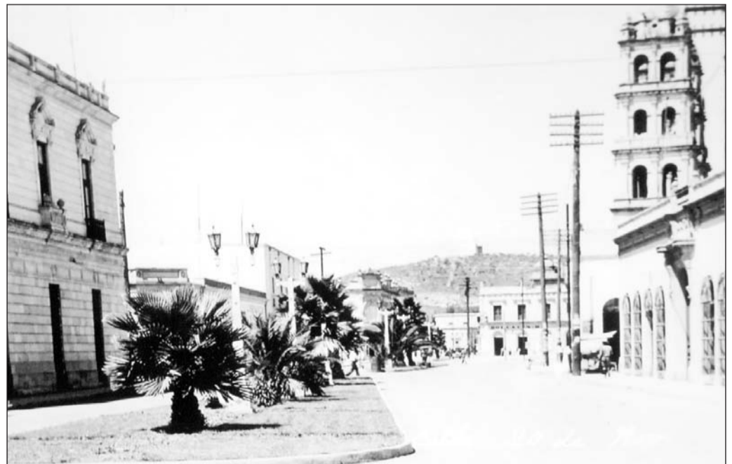
La simbólica avenida 20 de Noviembre algunos años atrás.