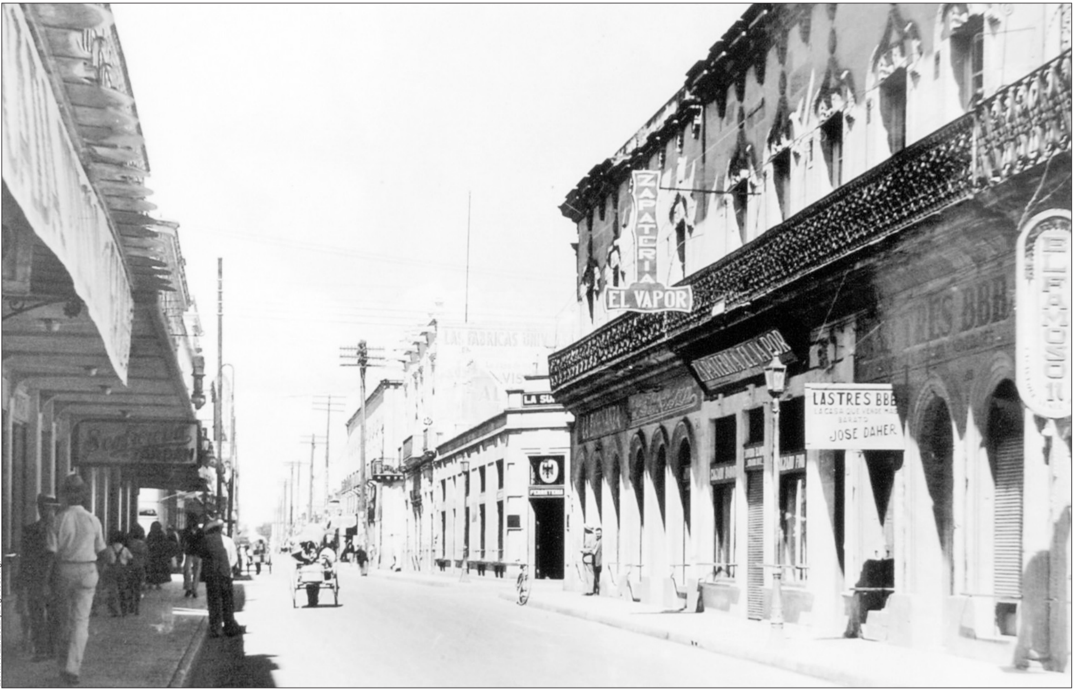
Bella postal en donde se aprecia la calle 5 de Febrero, sitio emblemático del comercio en Durango.