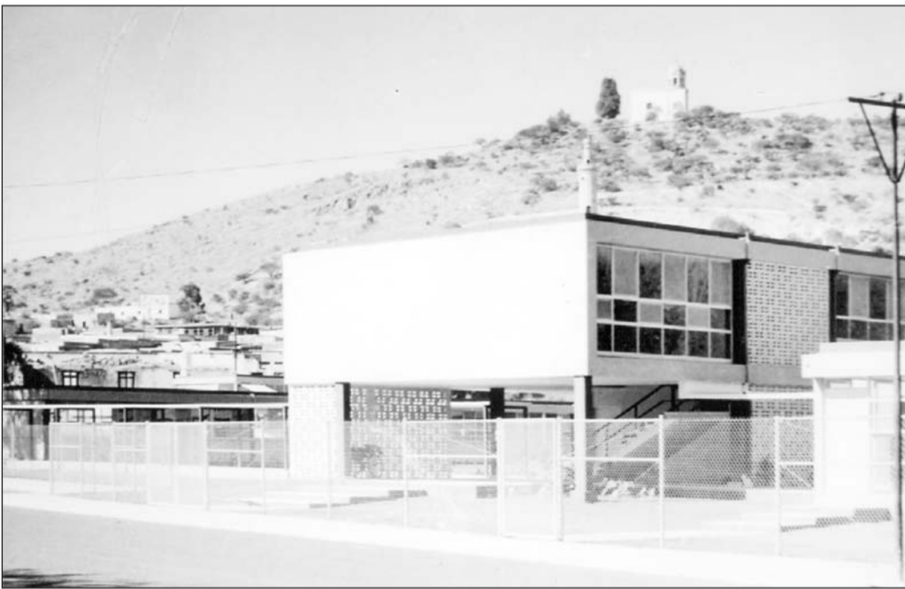
Así lucía la Facultad de Medicina de Durango.