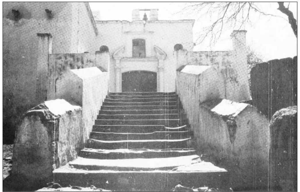
Hacienda de La Ferrería muchos años atrás antes de su remodelación.