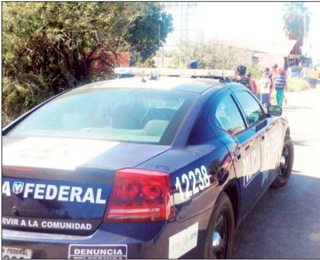
Suceso. El conductor de la unidad se fugó, según el reporte de la autoridad.