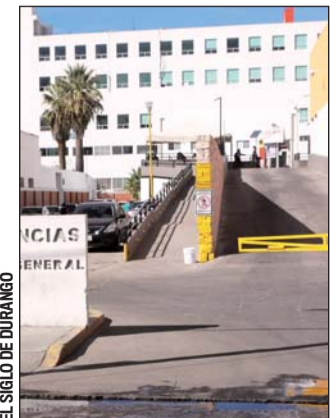
El lesionado resultó con traumatismo craneoencefálico severo y trauma de tórax.

Se trasladaba a bordo de un vehículo de la marca Toyota, línea Camry, 2015, guinda, conducido por Isidro, de 41 años de edad, y a la altura del kilómetro 12+700 se impactó contra un semoviente que cruzaba por la carpeta asfáltica, con el resultado ya descrito.