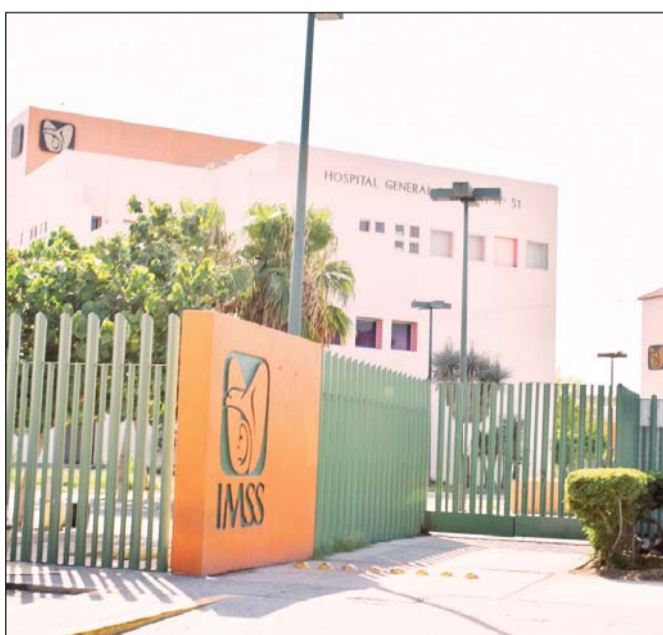
Reporte. Ingresó al hospital con una herida de bala en el glúteo derecho, con un estado de salud estable.

Minutos después los paramédicos arribaron en la ambulancia y, tras brindarle los primeros auxilios al lesionado, lo trasladaron