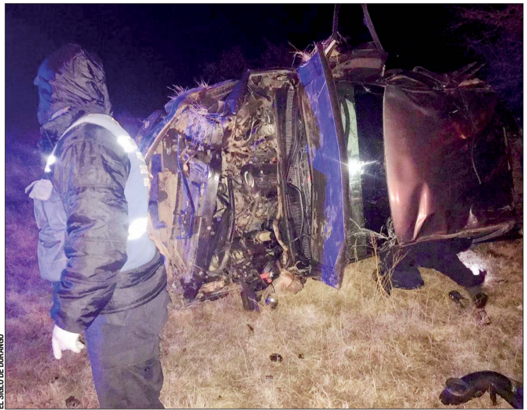
Atención. Confirmaron el fallecimiento de tres y dos más resultaron con lesiones.

Al arribar los cuerpos de rescate se encontraron con un camioneta marca Chevrolet, línea Silverado, modelo 2002, color gris, placas FX3023A, la cual se encontraba volcada a la orilla de la cinta asfáltica,