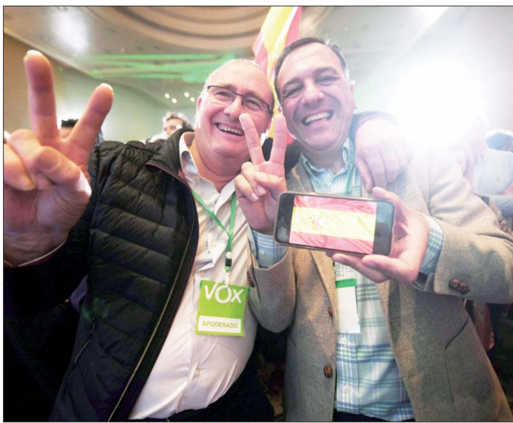
Ruta. España celebra elecciones municipales, regionales y europeas el 26 de mayo, y los resultados de Andalucía serán analizados también sin duda en ese contexto.