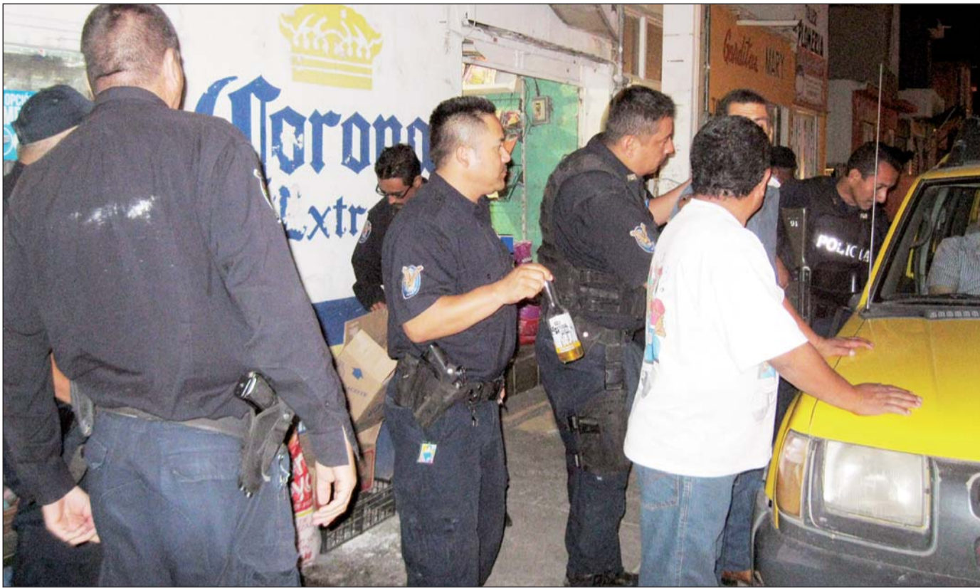
Garantía. Cada fin de semana se implementan operativos para detectar a conductores ebrios, pero a pesar de las diferentes acciones y de los accidentes registrados todavía no se genera conciencia sobre esta problemática.

pio de Durango redobla esfuerzos para seguir trabajando y gestionando recursos de la mano de diversas corporaciones de seguridad como una estrategia en beneficio de la ciudadanía, que abone a mantener a Durango posicionada como una de las ciudades más seguras del país.