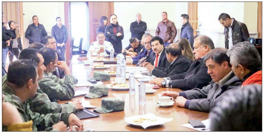
En Durango prevalece la paz y es una de las ciudades con mejor percepción de seguridad.

Enriquez Herrera expresó los grandes avances que ha tenido la capital en la materia. "Somos una de las ciudades más seguras del país y vamos a seguir trabajando por dar seguri-