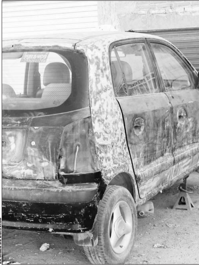
Oposición. Los vecinos suelen ser quienes más se quejan de los yonkes en las colonias.

La dependencia municipal enfatizó que durante este mes se reforzarán los recorridos del personal de Inspección, a fin de corroborar que los establecimientos de diferentes giros cumplan con los requisitos establecidos en las normativas municipales, independientemente de la zona donde se ubiquen.