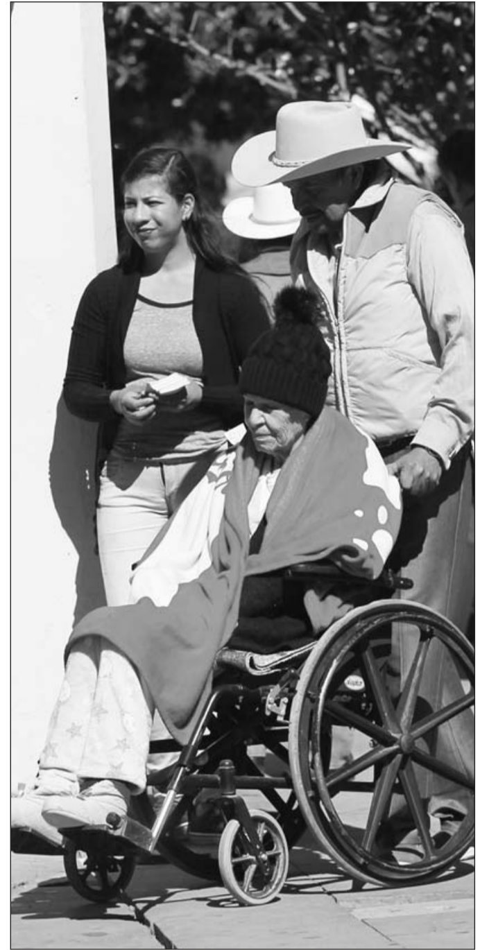
Necesidades. Señala Diputado la necesidad de apoyos para discapacitados para que puedan recibir apoyos para modificar sus viviendas acorde a sus necesidades.

La supervisión que inició este lunes es para verificar la calidad del equipo y material que se utiliza en el proceso de hemodiálisis y que no se esté reutilizando.