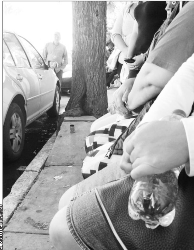
Contagio. Desde hace tres meses que se denunció el posible contagio de hepatitis C en una clínica particular; todavía no hay cerco sanitario.

Para los días jueves y viernes de esta semana el Servicio Meteorológico Nacional pronostica días muy nublados tanto por la tarde como por las noches.