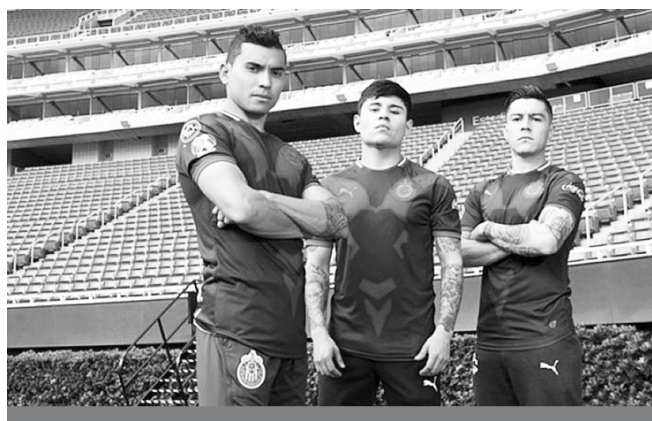
Marketing. Chivas presenta uniforme alternativo de cara al Mundial de Clubes.

Alguna vez sacaron algo similar, donde en el diseño se difuminaba los cuernos de la chiva, pero el uniforme era rayado en rojo y blanco.