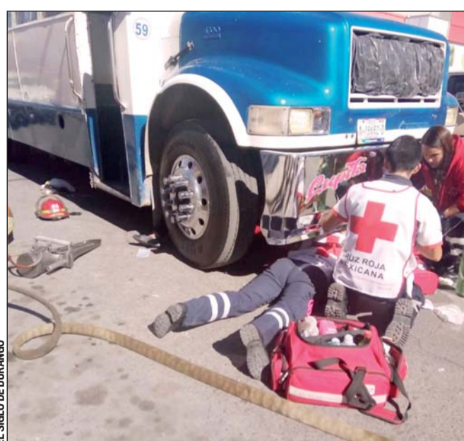
EL SIGLO DE DURANGO