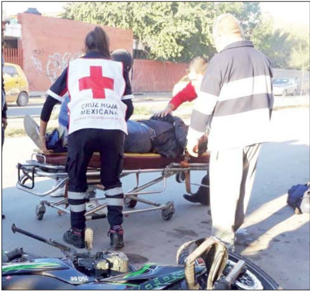
Percances. Los accidentes que involucran a motociclistas siguen a la orden del día.