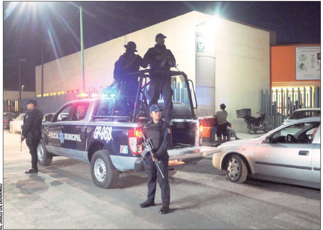
Violencia. Ambos hechos se suscitaron casi de manera simultánea.