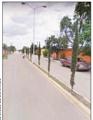
El sexagenario perdió la vida horas más tarde mientras recibía atención médica.

Las investigaciones establecieron que al intentar bajar del caballo perdió el equilibrio al atorarse un pie en una sogá, por lo que fue arrastrado varios metros. Tras este incidente, el sexagenario fue trasladado al hospital San Juan Bautista de Durango, donde pereció por traumatismo de tórax y abdomen.