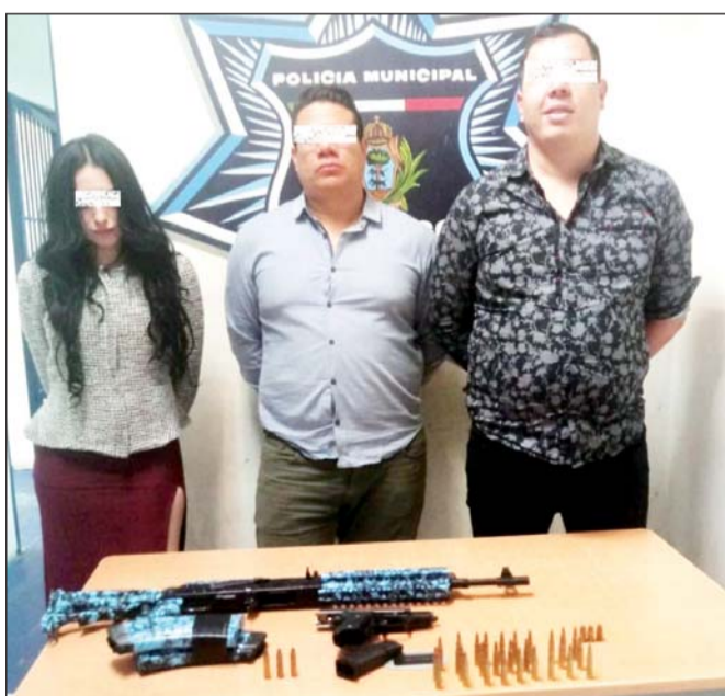
Seguridad. Todos los detenidos fueron puestos ante el Ministerio Público Federal para que se inicie con la investigación.

Al detectar su actitud sospechosa se les realizó una revisión mediante la cual se les encontró una arma corta calibre 357, con un cargador abastecido y tres cartuchos útiles, así como una arma larga tipo AR-15, calibre 223, con un cargador desabastecido y un cargador abastecido con 28 cartuchos útiles.