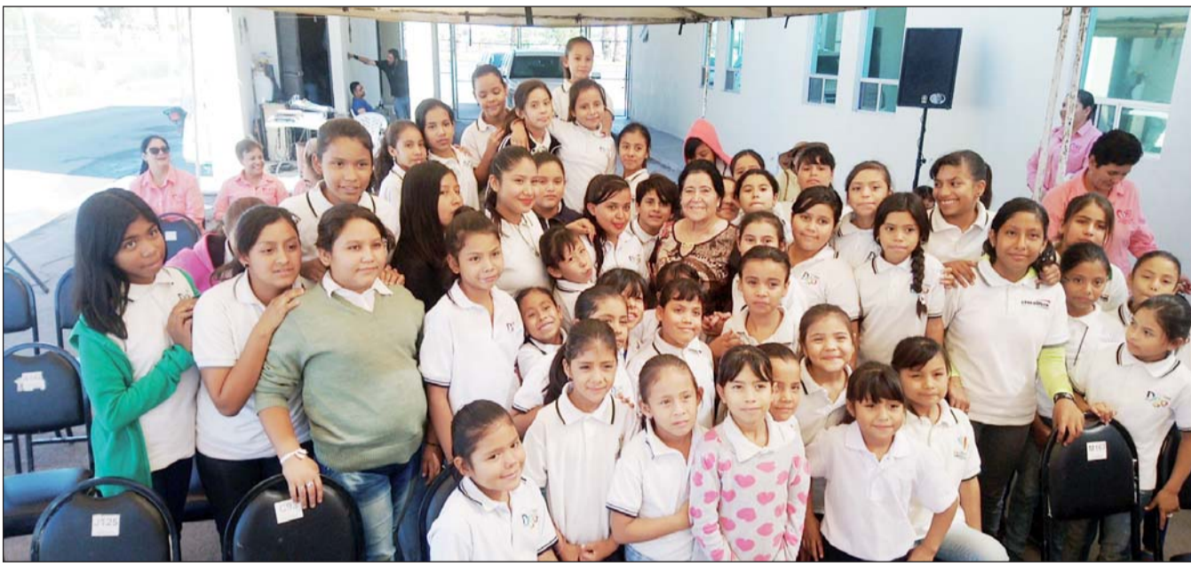
Niños. Aproximadamente 500 mil niños y niñas, en todo el estado, estarán recibiendo su aguinaldo y paquete invernal por parte del DIF Estatal en los próximos días, se iniciará por los municipios serranos.