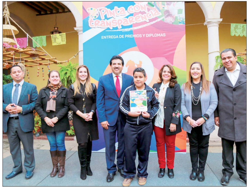
Los ganadores recibieron premios desde mil hasta 3 mil pesos a los mejores trabajos.

Por medio de la creatividad lograron plasmar dibujos únicos que tenían de base el tema de transparencia, donde se evaluó la originalidad, creatividad, técnica y presentación, mismas acciones que el Gobierno Ciudadano mantiene esta importante herramienta para su difusión y práctica.