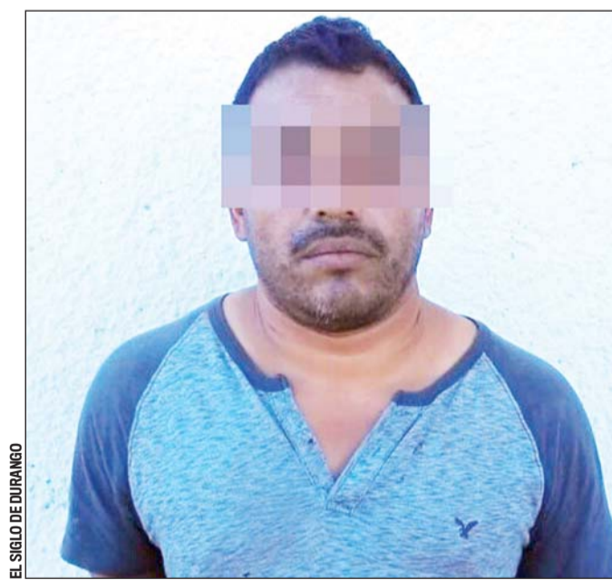
EL SIGLO DE DURANGO

co de los separos municipales confirmó que estaba drogado con marihuana.