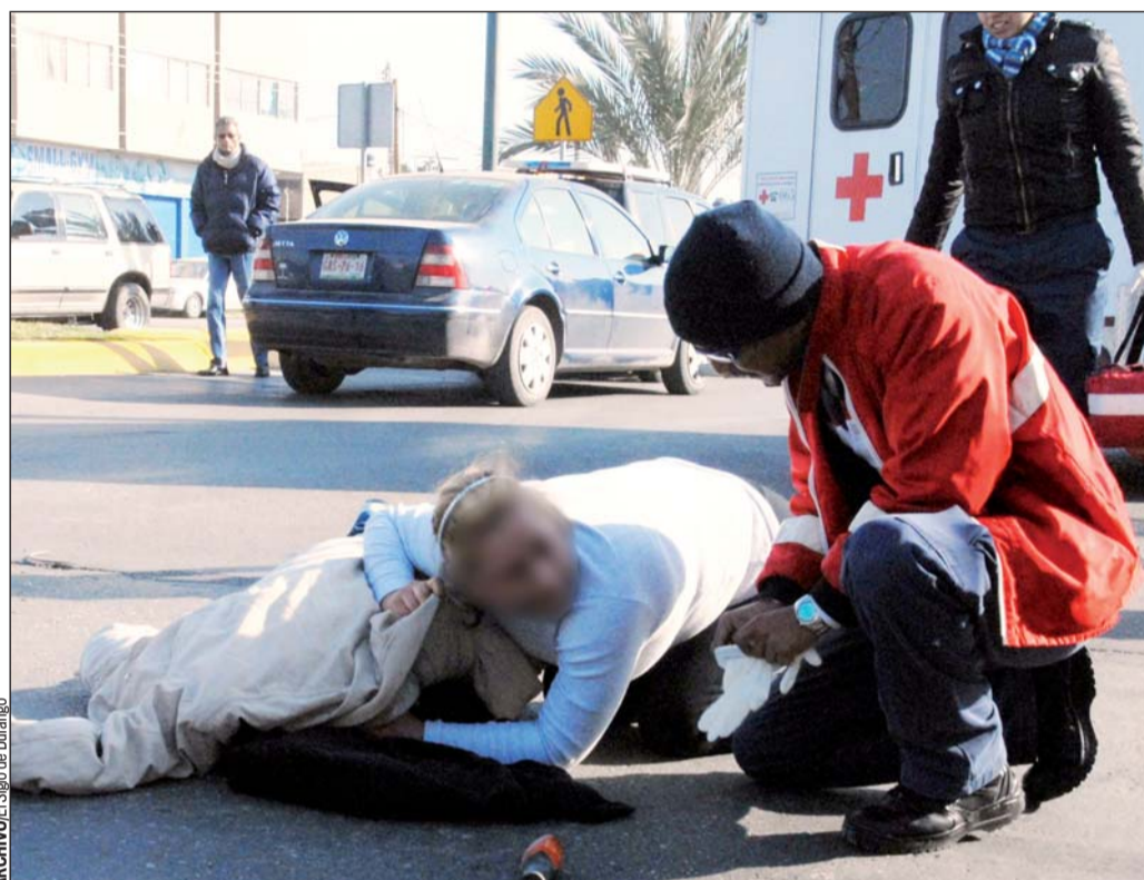
Víctima. El hombre de 70 años de edad, recibió un fuerte impacto por un autobús de pasajeros.

El anciano quedó tendido en el suelo hasta que llegaron los paramédicos de la Cruz Roja y le brindaron los