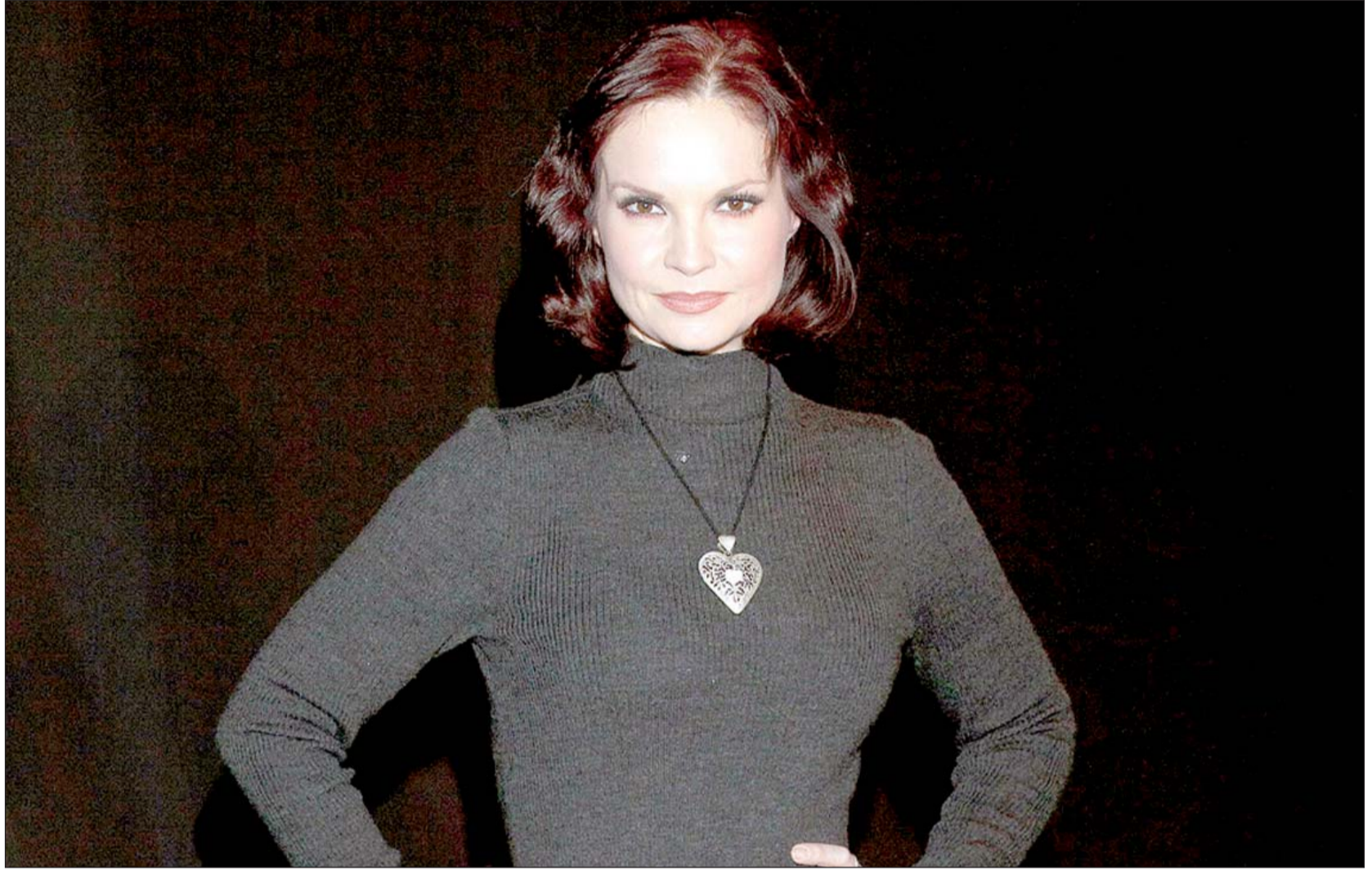
Propuesta. La actriz interviene en 'El triunfo de vivir' en la que da vida a una madre cuyo hijo menor padece cáncer.