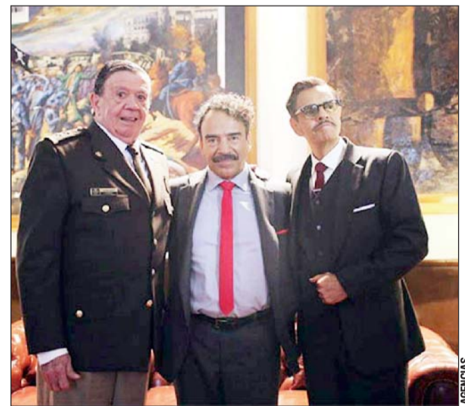
A fondo. Damián Alcázar es quien protagoniza este drama junto a Bárbara Mori, Eugenio Derbez y Xavier López 'Chabelo'.