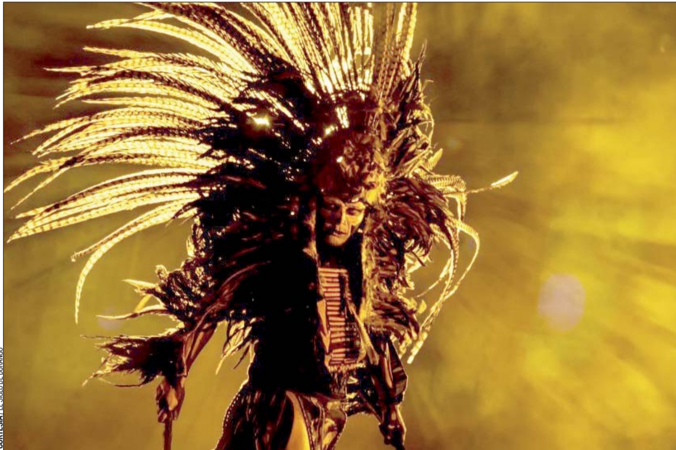
Al aire libre. El espectáculo 'Tierra de fuego' se presentará a las 20:00 horas en la Plaza IV Centenario.

Conferencias, exposiciones y espectáculos multidisciplinares integran el primer día de actividades.