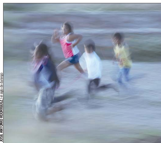
Niños. Hoy en día hasta los misños niños se atreven a denunciar la violencia que llegan a sufrir sus compañeros.

Tan solo ella, directamente le han manifestado de seis casos en lo que va del año de los cuales en cinco han sido positivos, sin contar los que se denuncian de forma oficial en alguna dependencia.