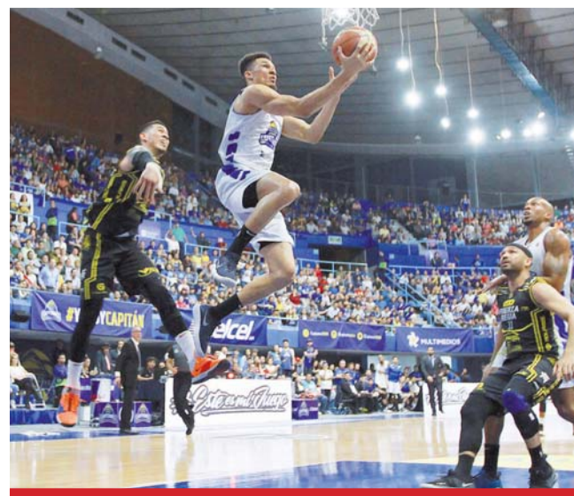
Final. Esta noche se juega el sexto juego de la Final con ventaja para Monterrey de 3-2 sobre Capitanes.

Sí, sin duda está en su mejor momento de la historia. Pero pensamos que aún tenemos muchas áreas de oportunidad para que la liga mejore, no sólo en lo deportivo, también en el tema de negocio.