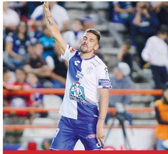
Goliza. Pachuca le metió nueve goles al Veracruz en la fecha 14 del Clausura 2019.

No todo estaba escrito y las dos ofensivas dieron su último ataque, en donde Toros armó un rally de cuatro carreras por dos de Durango para finalizar el encuentro 9-4.