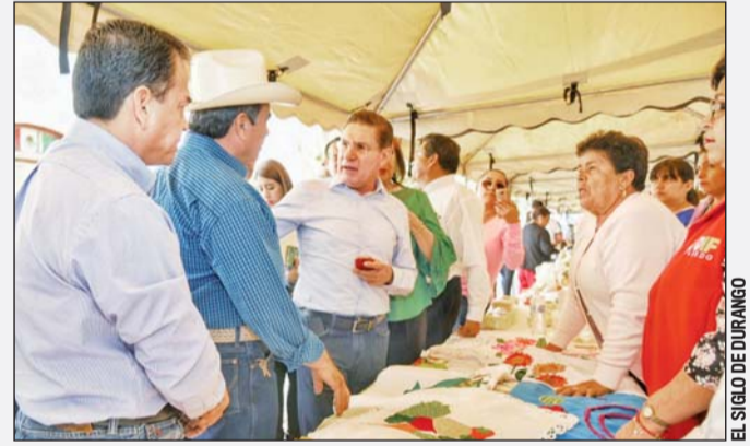
Los tres niveles de Gobierno acordaron cómo invertir 366 millones de pesos en el campo en beneficio de los pequeños y medianos productores rurales.

En este programa se pretende trabajar en la pre-