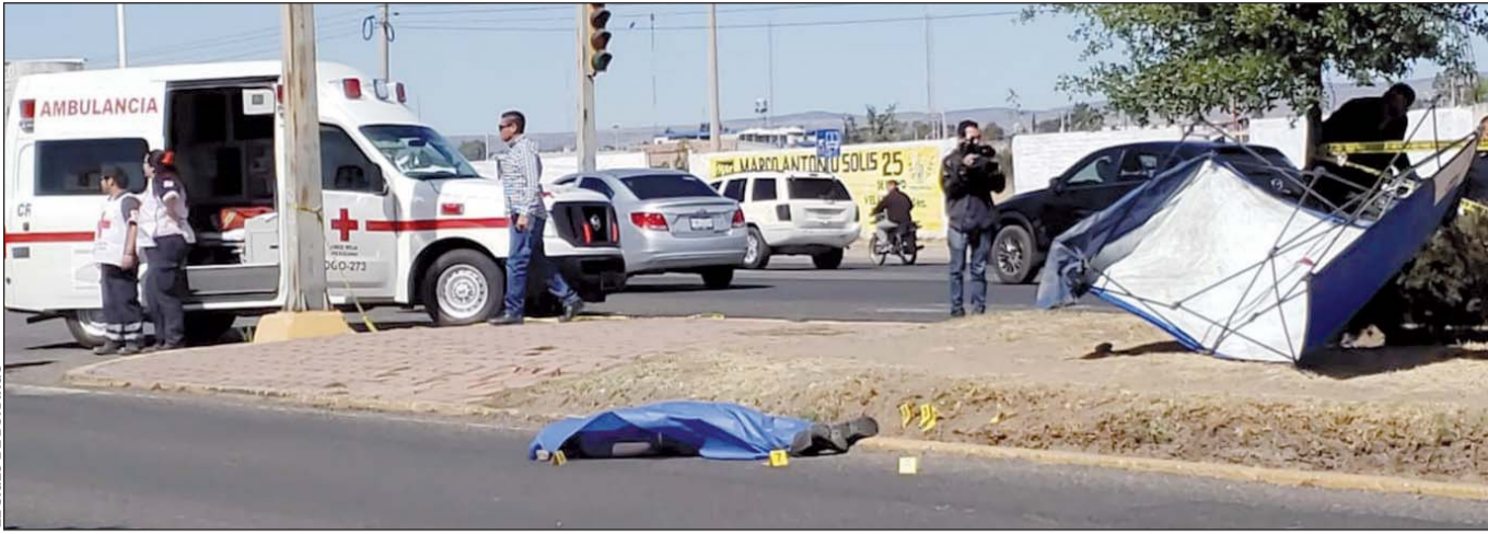
Contrastes. Hace una década inició una escalada de inseguridad que dejó a cientos de personas sin vida a consecuencia de homicidios dolosos.