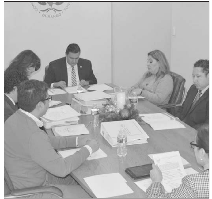
Respuesta. No hay avances ni totales ni parciales.

Además de Guadalupe Victoria, la Secretaría de Educación también es objeto de una recomendación, la cual tampoco registra avances, ni parciales ni totales en el cumplimiento de las disposiciones de la Comisión Estatal de Derechos Humanos.