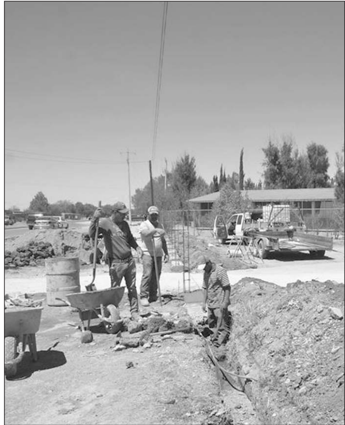
Apoyo. Padres y maestros solicitaron la construcción de la barda perimetral.

RICARDO BELTRÁN EL SIGLO DE DURANGO Poanas, Dgo.