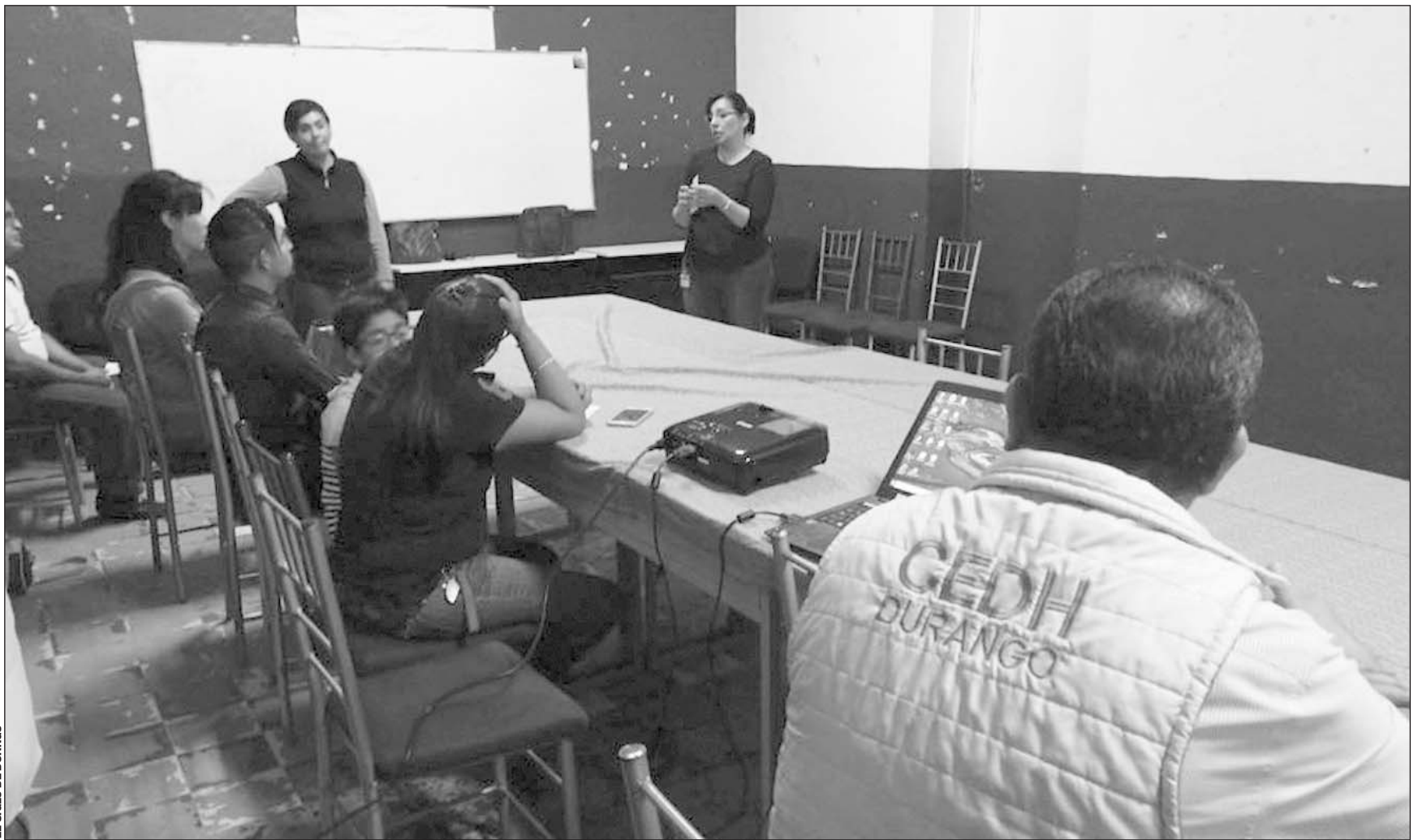
Causa. Entre las causas de violación está el uso excesivo de fuerza pública.

La Comisión también llamó a que se giren instrucciones para que se anexe copia de la resolución del procedimiento administrativo en expedientes personales de las personas responsables.