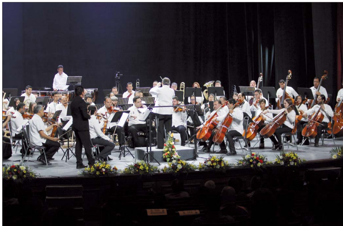
Sonidos. Los músicos presentaron un atractivo concierto en el que destacaron piezas de 'Star Wars' y de 'Piratas del Caribe', entre otras.

La orquesta ofreció un recital didáctico dedicado a los pequeños duranguenses.