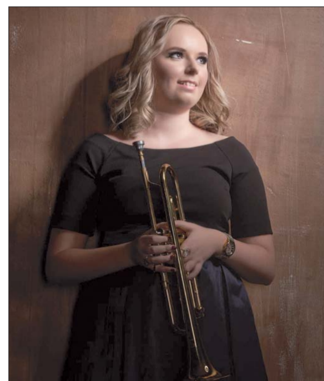
Escenario. La multipremiada trompetista tendrá dos presentaciones en Durango; una con orquesta y otra individual.

La trompetista tendrá una segunda presentación en la ciudad el martes 16 de abril, también en el Teatro Ricardo Castro a las 20:00 horas.