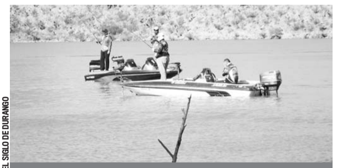
Pasión. Los mejores pescadores, en busca de la mejor lobina.

JUAN ÁNGEL CABRAL EL SIGLO DE DURANGO Durango