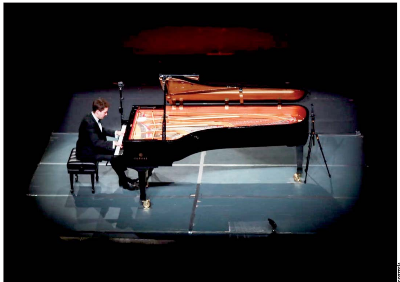
Espacio. La velada se celebró en el Teatro Ricardo Castro ante un nutrido público.