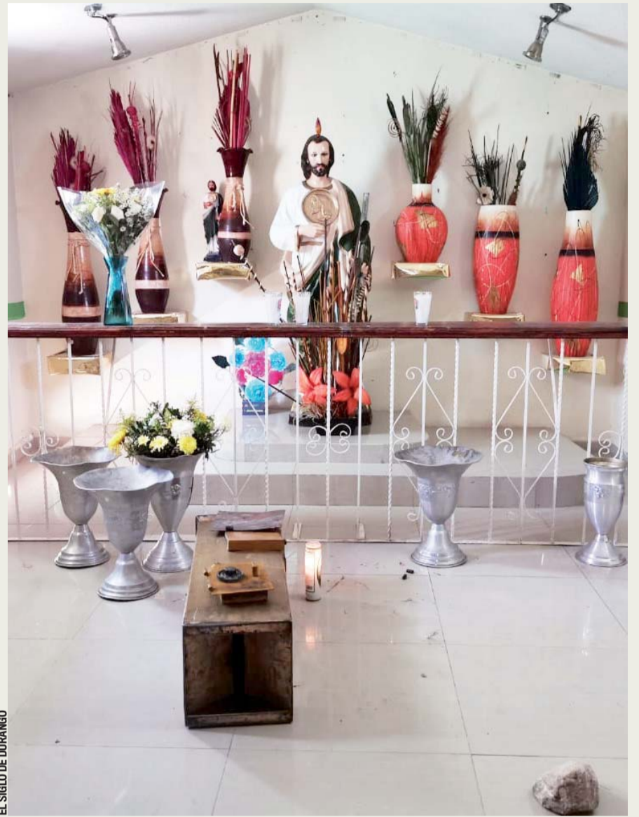
EL SIGLO DE DURANGO

En su conferencia de prensa matutina, Andrés Manuel López Obrador aseguró que el objetivo del decreto es acabar con los privilegios fiscales.