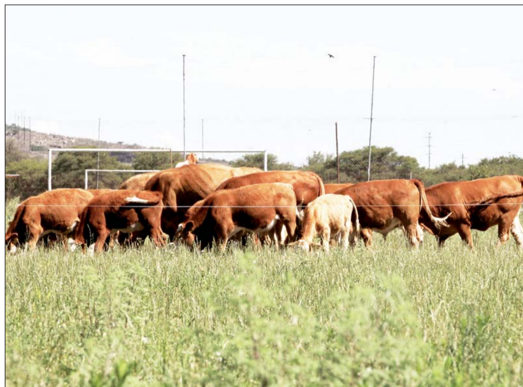
Ganado. A pesar de que no han llegado los recursos federales para el programa de sanidad animal a Durango, el estatus de exportación no está en riesgo.

Actualmente el hato ganadero que tiene Durango es de aproximadamente mil 200 cabezas de los cuales 900 mil son vientres.