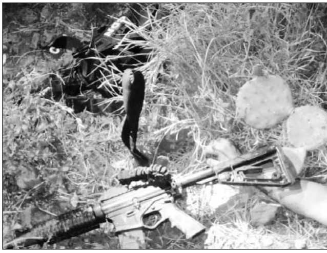
Versiónes. Autoridades municipales reportan de manera extraoficial al menos 25 muertos, lo cual aún no es confirmado por las autoridades estatales.