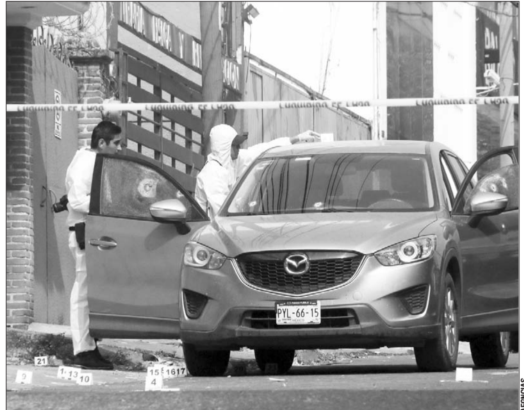
Cifras. Pese a la reducción, el cuatrimestre de 2019 cierra como el más violento del que haya registro; crímenes crecieron en 16 estados. El inicio del gobierno de López Obrador registra 43% más homicidios que el de EPN.

Los datos de incidencia delictiva actualizados este